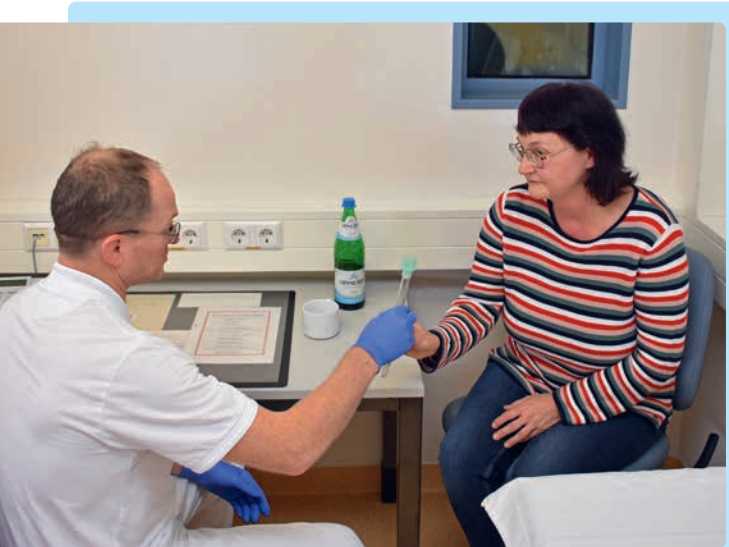
Verabreichung der Therapiekapsel durch das ärztliche Personal