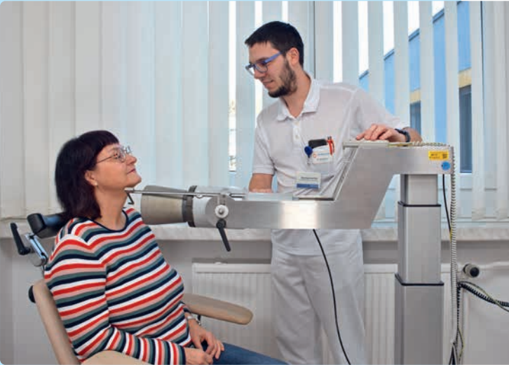
Messung der Speicherwerte